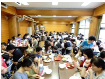
子ども食堂 おとなも子どももわきあいあい

が与えられ、そのテーマについて調べたことを発表し、その発表の仕方や中身を競い合うイベントです。「スーパーサンダー」は「メダカ」について発表し、他の学校の5、6年生を抑え、千里会場の達人に選ばれました。おめでとうございます！8月31日の各会場の達人たちの代表選でもぜひ頑張ってください。