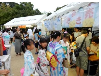
ふるさと とねやま夏祭り 夏休みの最後をしめくくるイベントになりました