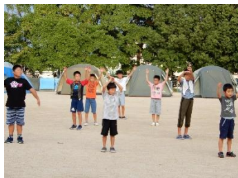
校庭キャンプ 夜の学校がワクワクでした。大学生も良かったです！