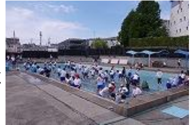
プール清掃のようす

6 月 9 日（月）より水泳授業が始まります。安全に十分配慮して行いたいと思っております。保護者の皆様におかれましても、5 月 19 日付で配布しております「水泳学習について」を再度ご確認くださいませようよろしくお願いたします。（確認できない場合は、学校までお問い合わせください。）