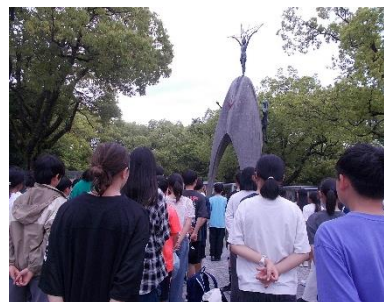
平和公園でのセレモニー