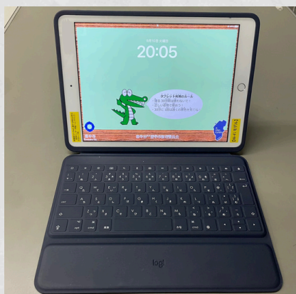
配備されたiPad（第8世代）