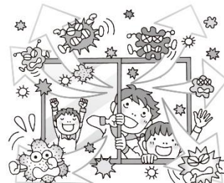
【ウイルスや細菌を外に出す】