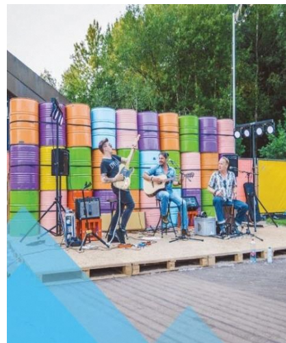
南部地域魅力向上事業のイメージ図