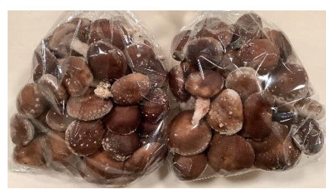
👉旧野田小学校で栽培されている椎茸

これ以外にも さつまいもや米 (5年生が田植え 体験した田んぼ で収穫)も使用し ます!