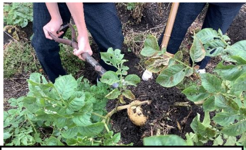
👉じゃがいも(品種/でじま・にしゆたか)

食育だよりNo.13 で紹介した、庄内さくら学園キャリア教育の一環として実施している「キッチンカー」ですが、販売日の12月3日(水)と4日(木)が目前となりました。3年目の今年は、「地産地消」にも着目し、身近な生産地の食材、また、「6年生教室前テラス」で育てた一部の野菜をメニューに使用してもらう予定です。