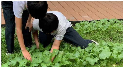
👉ほうれんそう・こかぶの収穫の様子