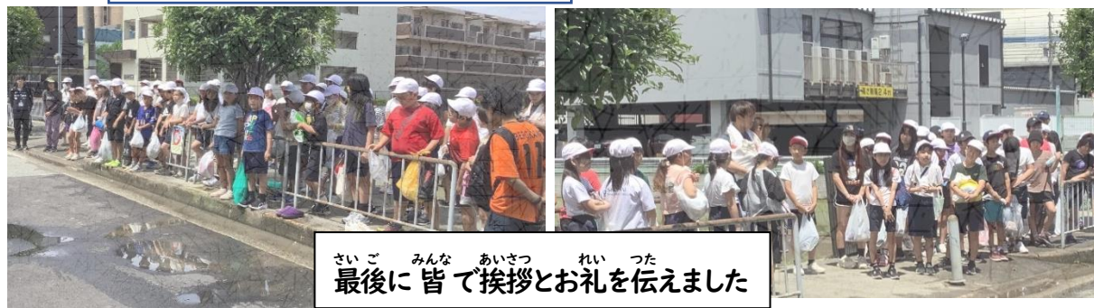
さいごみんなあいさつ 最後に皆で挨拶とお礼を伝えました

これから苗は、秋までにどんどん成長していきます。近くを通ることがあれば、ぜひ見てください! 今日田んぼで収穫された米は、小学校給食でも使用しています。次回は、稲刈り体験ができるというのを考えています。