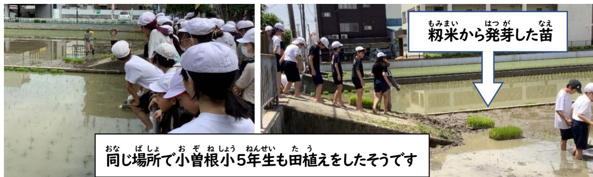
もみまいはつがなえ もみまいから発芽した苗

6月13日、さくら学園から歩いていける小曾根地区の田んぼをかり、実際に田んぼの中に入り、田植え体験をしました。小学校入学前に田植え体験をしている学園生も数人いましたが、泥の中に入る経験のない子がほとんどだったため、足を入れて歩くだけで大騒ぎでした。1人3、4束を田んぼに植えていきましたが「もう入りたくない～」と言う子もいれば、「もう終わり?」「泥の感触が良いから出たくない」という子もいました。また、普段見ることのない生き物にも触れ合えて「学校に連れて帰りたい!」と言う子も多かったです。現代では、機械で田植えをすることがほとんどですが、機械では植えられない場所などは、今でも手で植えています。