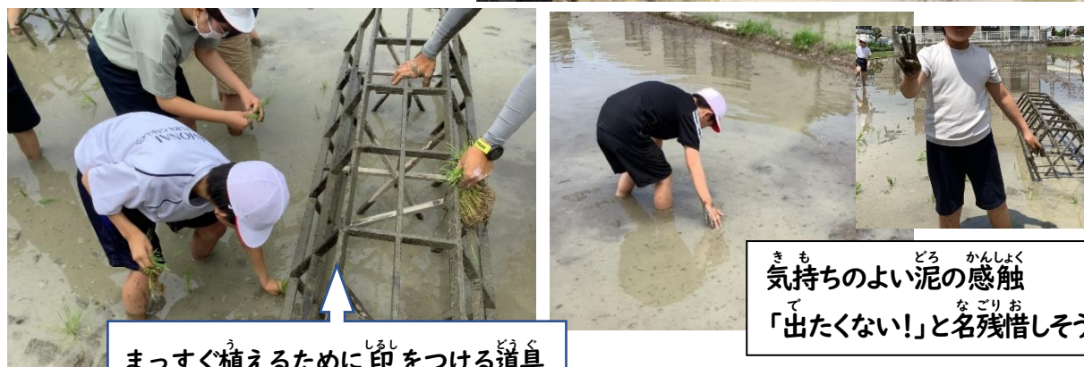
まっすぐ植えるためにしるしをつける道具