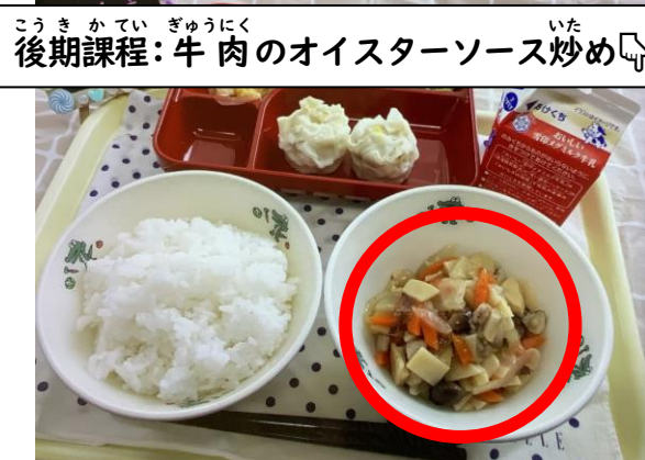
後期課程：牛肉のオイスターソース炒め