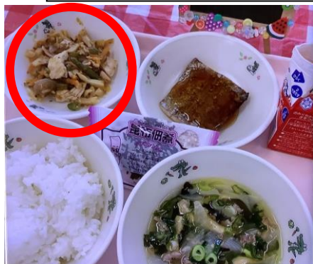
前期課程：たけのこのおかか煮