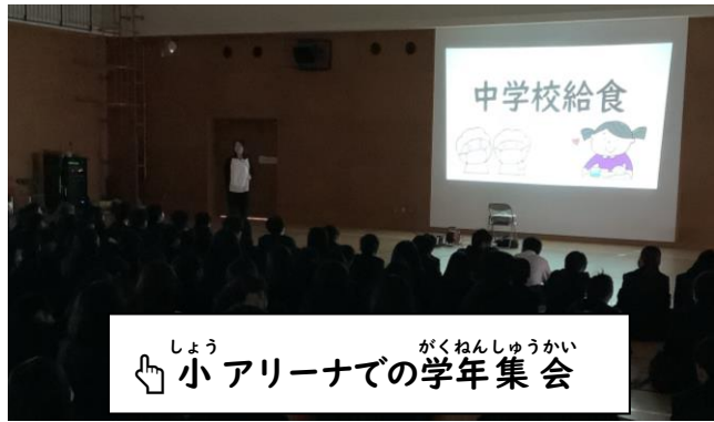
しょう がくねんしゅうかい 小アリーナでの学年集会

4月10日から2～9年生の給食が始まりました。7年生は、小学校給食から中学校給食へ内容が変わるため、学年集会で給食についてお話ししました。時間が短かったので、伝えきれなかった内容は給食時間に話していきたいと思ひます。