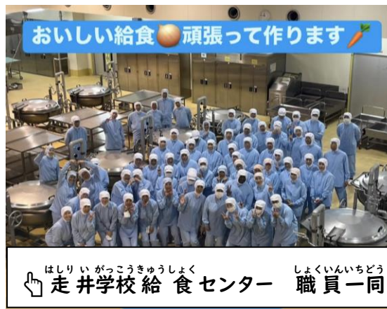
おいしい給食 頑張って作ります