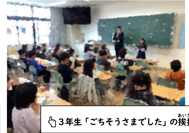
3年生「ごちそうさまでした」の挨拶