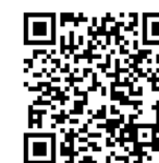
Youtube 用 QR コード