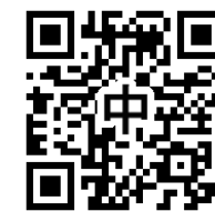
中学校給食用 QR コード