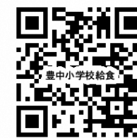
小学校給食用 QR コード