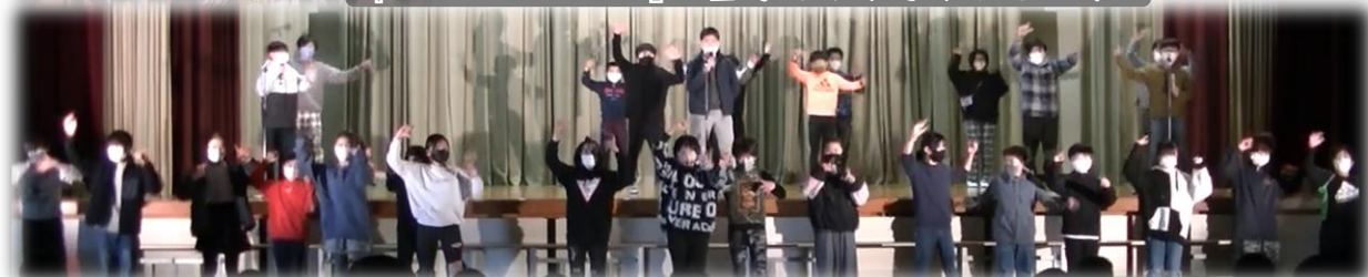
『MUSIC STATION』 全力でやりきりました!