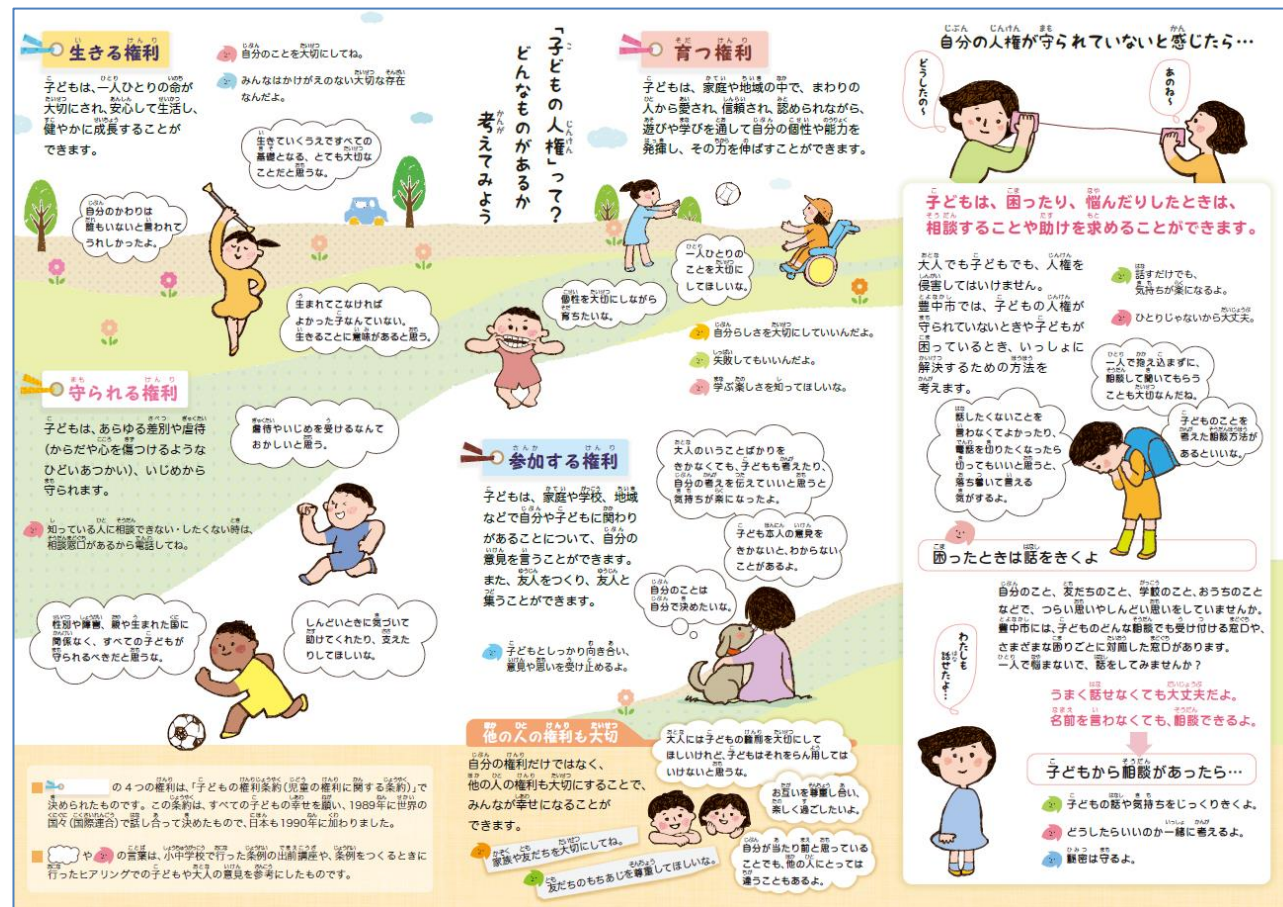
↑豊中市子ども健やか育み条例のリーフレット(毎年5年生対象に配布されます)