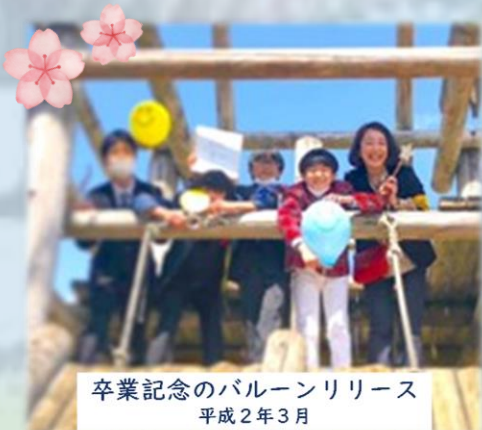
卒業記念のバルーンリリース 平成2年3月

卒業式のあと、息子とビッグランドの最上階まで登り一緒に撮った写真は、彼にとって小学校生活最後の一日の記念でもあり、私自身この小学校で過ごし、この小学校で保護者として子ども達を見守り、この地域のことを改めて思う、とても大切な節目の記念になりました。