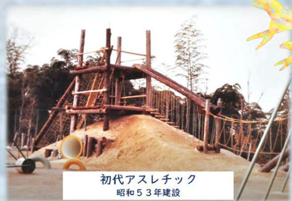
初代アスレチック 昭和53年建設

その数年前、開校間もない校庭に、学校と地域のシンボルになるような大きな遊具を建ててあげようと当時の大人たちが奔走し、電力会社から木製電柱を、水道会社から土管を譲り受けてそれは立派なアスレチックを製作しました。