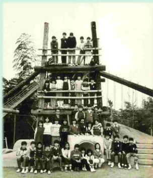
昭和55年3月卒業生(第5期生)アスレチックでのクラス写真

のどかなグラウンドの南西端に、昭和53年(1978年)3月、初代「アスレチック」が完成しました。このような大きな複合遊具はまだ目新しくみんなに大人気。6年生になるとクラス全員でアスレチックにのぼり、写真を撮影したクラスがありました。