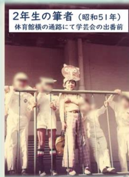
2年生の筆者(昭和51年) 体育館横の通路にて学芸会の出番前