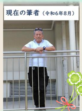
現在の筆者(令和6年8月)

私は4年生でしたが、木肌を撫で、ロープを握る感覚や、木とロープの“揺れ”や“きしみ”の不安定感にワクワクドキドキしたことが、今でも記憶に残っています。