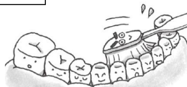
歯のうらがわ かみあわせのみぞ