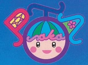
大阪府PTAキャラクター「ピタマル」