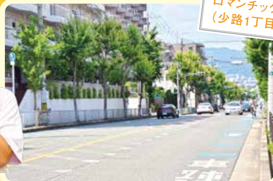
ロマンチック街道 (少路1丁目など)

府道豊中亀岡線の一部の愛称です。地域の皆さんにより、道路沿いに花が植えられたり、冬にはイルミネーションが飾られたりしています。