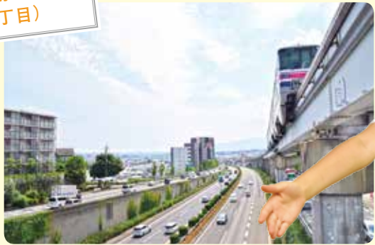
島熊山歩道橋からの風景 (緑丘2丁目)

島熊山は、万葉集で歌われたほど名高い場所です。島熊山歩道橋から見渡すと、豊中の市街地や六甲の山並みなどの景色を楽しめます。