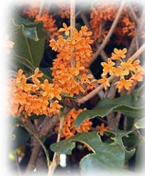
キンモクセイ (桜井谷小)

朝夕の寒暖差が大きくなる時期でもあります。皆様におかれましてもどうぞ、体調には十分にお気をつけてお過ごしください。