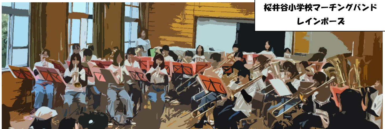
桜井谷小学校マーチングバンド レインボーズ