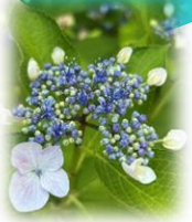
あじさい (桜井谷小)