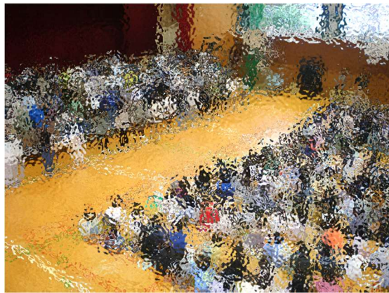
6年生からの思いを伝えます

これは、5年生以下の全校児童に向けて、6年生から折り鶴のお礼、そして修学旅行への思いを伝えるものです。全学年が心を一つにしての取り組みでした。