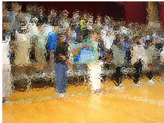
全校児童が折った千羽鶴の作品を披露