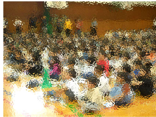
下の学年もしっかり聞いています