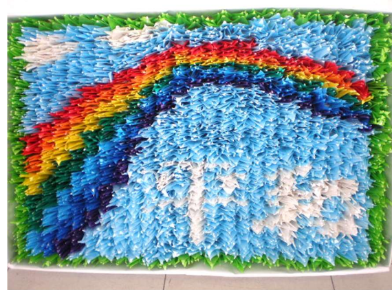
「平和」の文字がデザインされています。