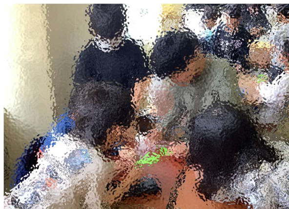
難しければいっしょにやってあげます