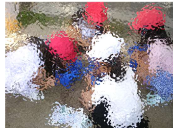
心を込めて種をまきます。「きれいな花が咲くといいなあ〜。」