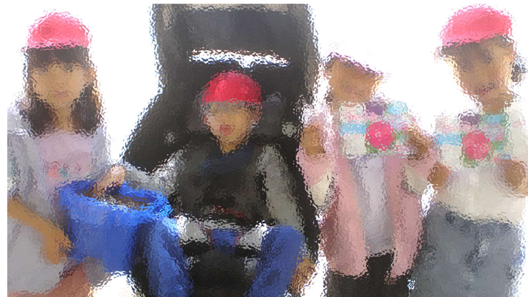
最後に記念写真です。