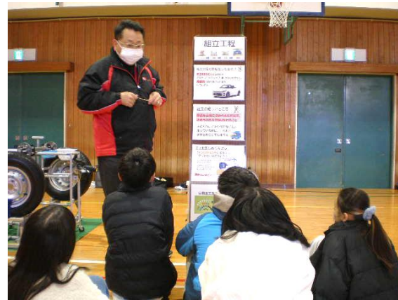
まず説明を聞きます。

子どもたちにとっていちばん興味を持ったところは、実際に自動車を作っていく作業を体験できたことでしょう。なかなか日常ではできないところなので、貴重な経験となりました。これも写真をご覧ください。