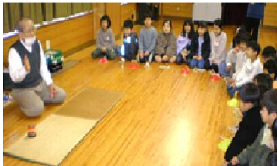
墨山さんに教えてもらいます