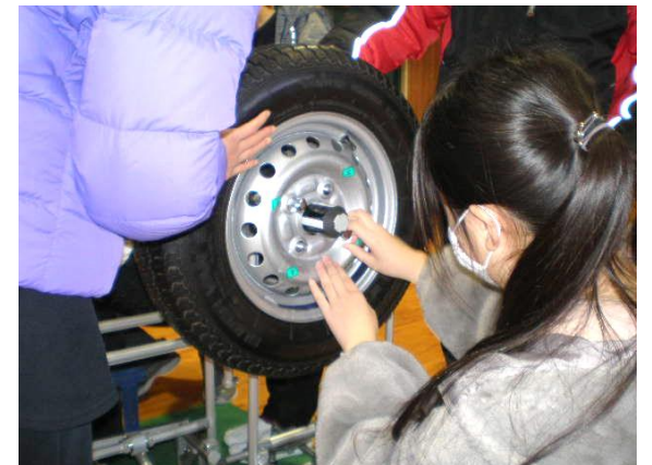
タイヤを取り付けます。