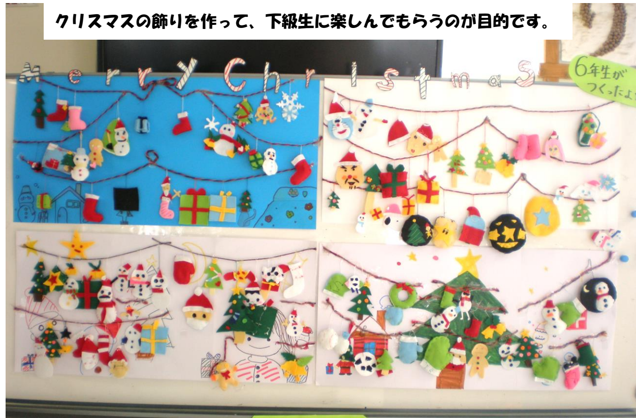
カラーでご覧になりたい方は、本校HPにて。