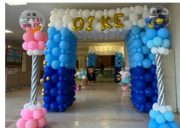
2025年度卒業式の入退場門