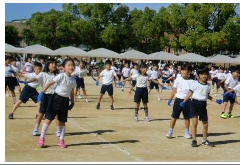
NO. 7 キミにサチアレ Let's☆Dance 2年