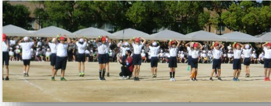
NO. 5 Let's Go おならび 五輪ピック 4年