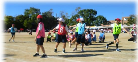
NO. 3 全員全力ゼンカイジャー6年