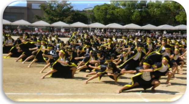
NO. 13 笑・揚・勝・絆〜心1つに筋肉パワー〜 5年