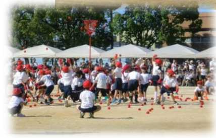
NO. 6 NaNaNaNa しゅー！ たまいれびよん 1年