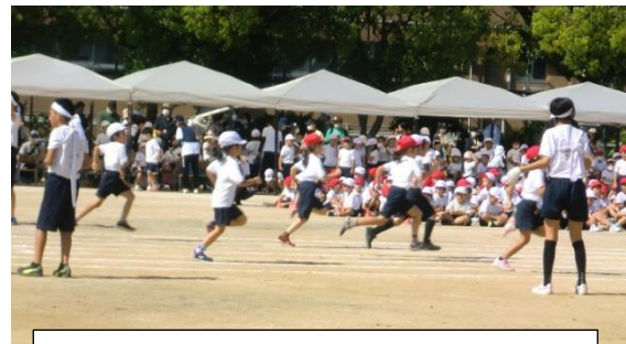
NO. 11 1・2・3どびだしえー1年