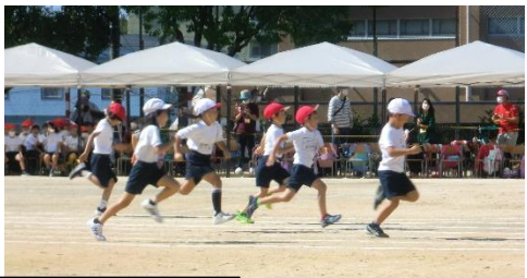
NO. 12 キミにサチアレ Let's☆Go 2年