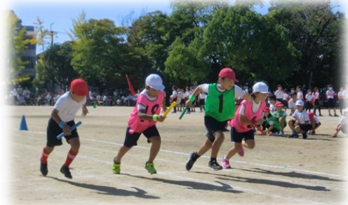
NO. 10 ワープ・リレー2022 4年