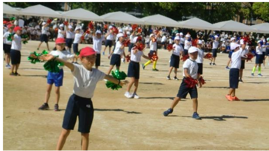
NO. 9 ぐうんと大きく野畑体操3年