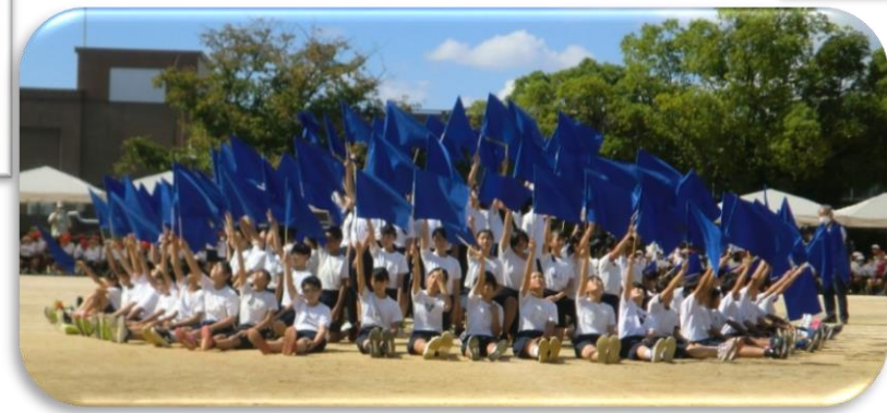
NO. 14 我が運動会に一片の悔いなし 6年