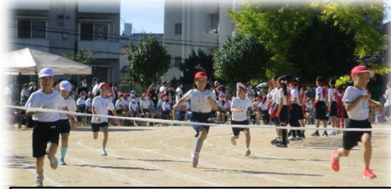
NO. 4ひとかたまりの風になって 3年