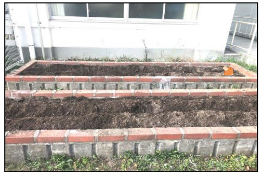
しゃしんだけでどこのはたけかわかるかな?