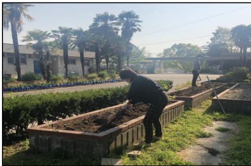
やさいをうえるようにたがやしたよ

2年生のみなさんこんにちは。1しゅうかんぶりの「にこにこ」ですね!しってる人もいるとおもいますが、らいしゅうからついに学校がはじまりますね!まだ1しゅうかんに1かいだけのとう校になりますが、先生たちはげん気いっぱいみんなにあえるのをとてもワクワクしています。今日の「にこにこ」は、やさいをそだてるための学びゆうえんをしようかします。