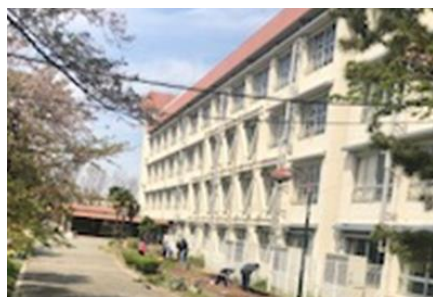
学級園を耕す教職員。いつでも種まきができます。

5月10日まで臨時休業が延長となり、11日以降のことも方向性が見えない中、この先どうなるのだろうという不安がぬぐい切れません。学校でも、感染拡大防止のために教職員の出勤が制限される中、できることをせいっぱいがんばって、前向きに、1日1日を大切にしていこうと、出勤している職員と在宅勤務の職員が電話やメールで連絡を取り合いながら業務を進めています。そんな中、教科書配布の時に保護者の方とお会いできたこと、電話を通してでしたが子どもたちの声が聞けたことは、私たちにとって、とてもうれしいことでした。お忙しい中、ご協力いただきありがとうございました。