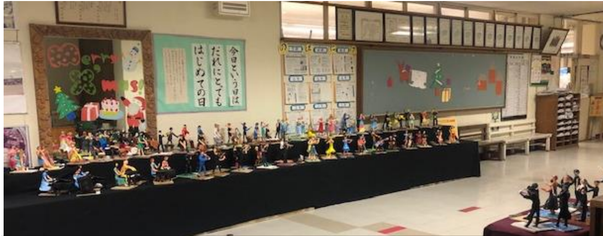
5年生が紙粘土で創った「オーケストラ」、流れているメロディは、音楽委員会の子どもたちが演奏する「きよしこの夜」。野畑音楽祭を締めくくる素敵な空間が職員室前に出来上がりました。来校者の方が思わず足を止めて見入ってくださいませ。3学期になってもしばらくの間、展示しておきたいと思っています。一人でも多くの皆さんに見ていただくと嬉しいです。

様々な制限があり、三密を避けての学校生活でしたが、そんな中でも子どもたちとともに前向きに、一日一日を大切に過ごした2学期でした。運動会・野畑音楽祭などの行事では、とても真剣に楽しみながら取り組む子どもたちの姿がありました。心配された学習の遅れも取り戻しました。その陰には、授業中にできなかった課題を放課後残って頑張っている子どもたちの努力がありました。ご家庭の皆様にも学校全体を温かく見守っていただき、励ましの言葉をたくさんいただいたおかげです。ありがとうございました。3学期もよろしくお願いいたします。