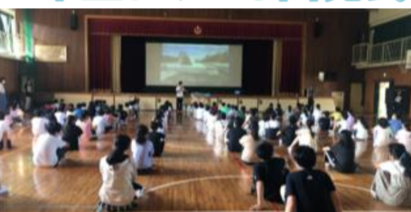
6年生が平和への願いを込めて折った「おりづる」を広島へ送り出す式をしました。8月29日に広島に届けます。

リモート始業式の様子。今回は、6年3組の教室をスタジオにして、各教室に配信しました。まだまだ環境が整っていないので、うまくつながらない教室があったり、音声がか切れたり、ハプニングだらけですが、そこは野畑の子どもたち、教室移動等臨機応変に気持ちよく対応し、無事始業式を行うことができました。