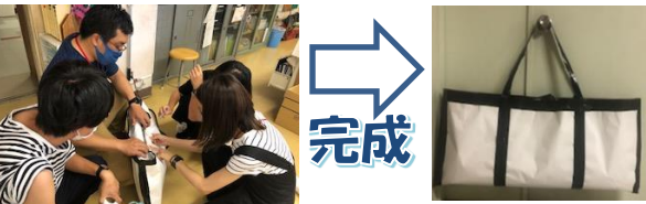
「おりづる」を入れる袋づくりにあーでもないこーでもないと悩む6年担任。