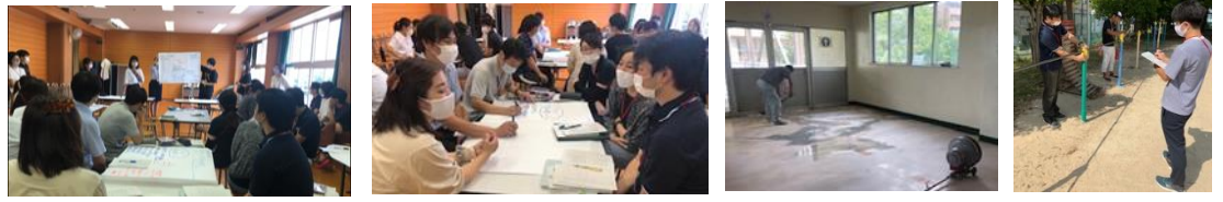
今までとは違う、今年からの新しい教育課程における評価はどうあるべきか話し合いました。廊下をポリッシャーで磨いてワックスかけ。遊具安全点検の様子