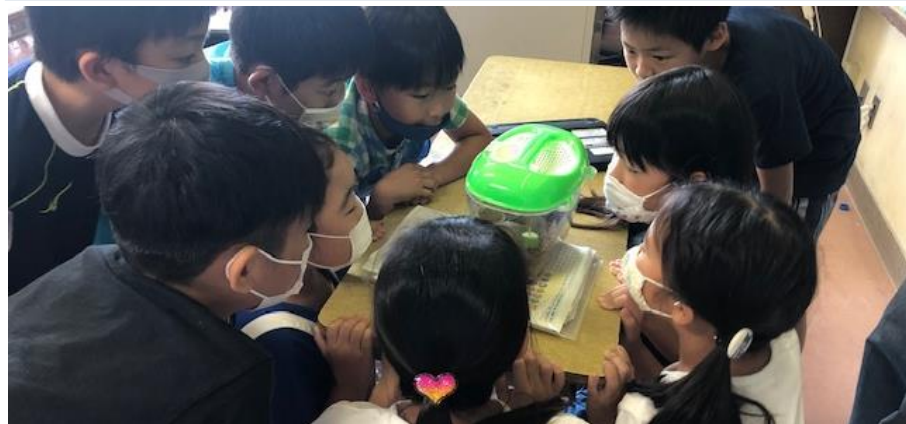
がんばっている子どもたちが、少しでも楽しんでくれたらと元職員から寄付されたカブトムシのかごを囲んで観察する子どもたち。

一方、6年生の子どもたちは、8月6日まで通常授業です。1学期のまとめをしながら、「平和学習」にも、取り組んでいます。今年は、修学旅行で広島に行くことができないので、8月6日に広島で行われる「平和記念式典」にあわせて、「平和の集い」を計画しています。日に日に、最高学年らしくたくましくなっていく子どもたちです。