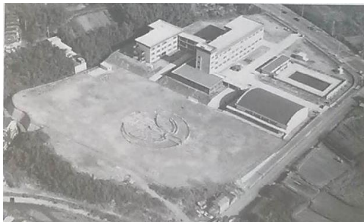
1974年当時の野畑小学校

昭和53年（1978年）北緑丘小学校・桜井谷東小学校新設のため、北緑丘地区は北緑丘小学校へ、向丘1丁目は、桜井谷東小学校へと校区変更しました。