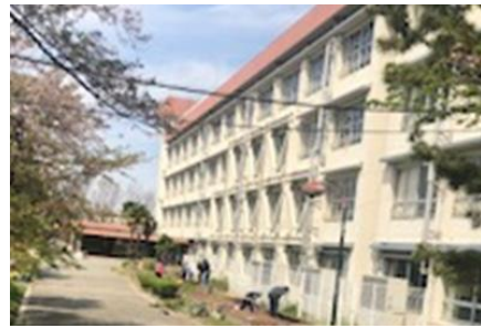
学級園を耕す教職員。いつでも種まきができます。

5月10日まで臨時休業が延長となり、11日以降のことも方向性が見えない中、この先どうなるのだろうという不安がぬぐい切れません。学校でも、感染拡大防止のために教職員の出勤が制限される中、できることをせいっぱいがんばって、前向きに、1日1日を大切にしていこうと、出勤している職員と在宅勤務の職員が電話やメールで連絡を取り合いながら業務を進めています。そんな中、教科書配布の時に保護者の方とお会いできたこと、電話を通してでしたが子どもたちの声が聞けたことは、私たちにとって、とてもうれしいことでした。お忙しい中、ご協力いただきありがとうございました。