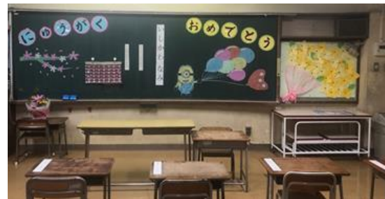
1年生の教室 子どもたちが来る日を待ちわびています。

ご家庭では、子どもたちとどう過ごそうかと様々な工夫をされていることと思います。おうちのかたがどうしても休めない、あるいはいつも以上に忙しくてというお宅もあることでしょう。困ったこと、心配なことがありましたら遠慮なく学校までご連絡ください。各学年の担当が対応できる体制にしています。裏面にスクールカウンセラーからのメッセージも掲載していますので、ご覧ください。