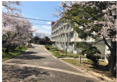
東門から見た満開の桜

今年は、厳しい条件の中での新学期スタートになりますが、教職員一同、前を向いて、子どもたち一人ひとりを大切に、「学校教育目標」の実現に向けて、精一杯努めてまいりますので、皆様のご理解とご協力を賜りますようよろしくお願い申し上げます。