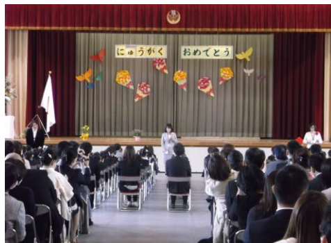
担任紹介の様子。右から1組・2組・3組

7日（火）に、規模を縮小して入学式を実施しました。体育館の窓と扉を全開して換気しながら、席と席の間を大きく開けて、式も教室にいる時間も短縮して行いました。例年入学式に参加している2年生と6年生の参加や来賓の皆様の参列のかなわなかった中でしたが、かわいらしい1年生の姿に、教職員一同あらためて責任の大きさを感じた日になりました。