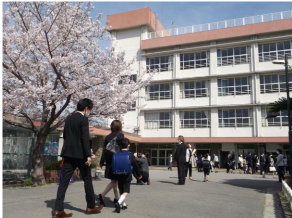
真新しいランドセルをしょって登校してきた新入生