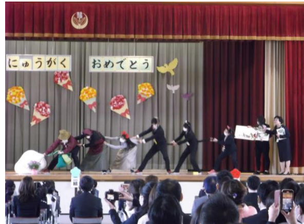
今年もしました。先生たちによる「おおきなかぶ」のげき