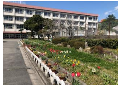
正門を入ったところの花壇の様子