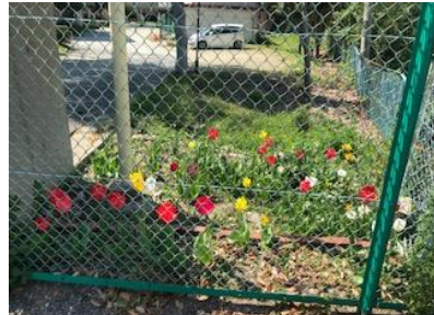
北門前の道路から見える花たち