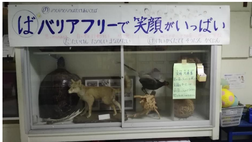
笑顔大募集！みんなの描いた笑顔を集めています。