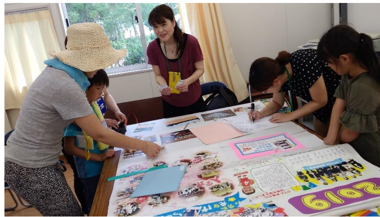
PTAの役員さん運営委員さんたちが、夏祭りの準備のためにプレハブに集まってパネルづくりをしている様子です。忙しいけれど、楽しそうに活動されているのがうれしかったです。お疲れ様です。