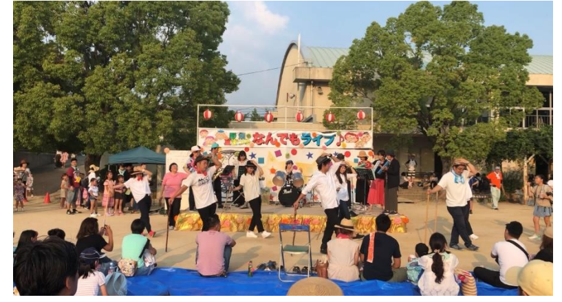
夏祭りでは、先生たちも子どもたちのなんでもライブの前座で、楽器の生演奏とダンスを披露しました。いつもと違う先生たちの姿に会場の皆さんから大きな拍手をいただきました。