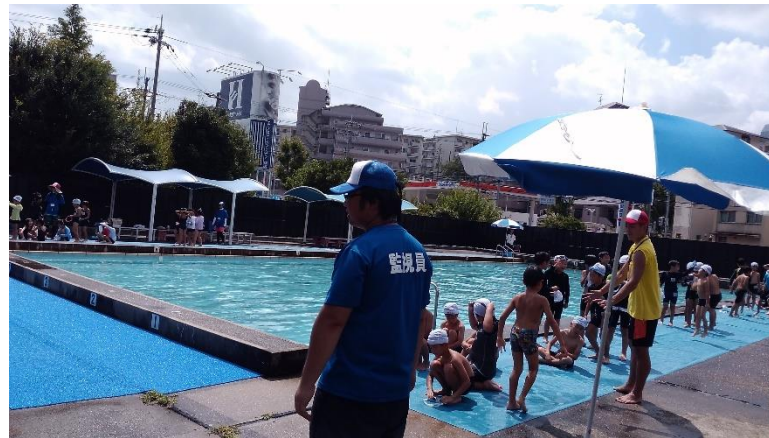
プール開放実行委員会による夏休みのプール開放の様子。地域と保護者と教職員のボランティアによって運営されています。今年は全9日間の内3日間だけ豊中市から監視員が派遣されました。

来年から新しい教育課程がスタートします。（裏面をご覧ください）そのため、3年生以上で外国語科のため週当たりの授業時数が1時間（45分）多くなります。それをどのようにするのが子どもたちにとって大きな負担にならずに授業効果を上げることができているのか今検討中です。15分を3回とるモジュールという方法をとることも考えられますが、豊中市の判断もまだ出ていないので決定するのは、3学期になると思います。単純に1時間増やすことになると、3年生は月曜日も6時間授業をすることになります。また、現在2年生は木曜日を6時間授業としていますが、来年度の2年生から火曜日を6時間にと考えています。