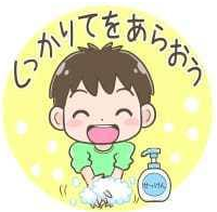
活動後にはしっかり手洗い