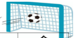
運動場 サッカーゴール 割り当て表 (2学期)

このルールを徹底してから約1か月が経ちましたが、現在は子どもたちがしっかりとルールを守り、安全に楽しくサッカーをしています。接触事故もなくなり、安心して遊べる環境が整っています。今後も安全な環境づくりに努めてまいりますので、ご家庭でも引き続きお声かけをお願いいたします。