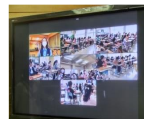
オンラインによる 交通安全教室 (講師:豊中警察)