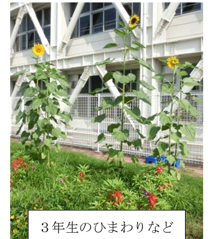
3年生のひまわりなど

まだまだ、外出等、自由にできない状態ですが、少しでも子どもたちが有意義に楽しく夏休みを過ごすことができるようにご協力をお願いします。2学期にはまた元気な子どもたちと会えること、楽しみにしています。