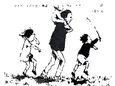
きょうは みんなで クマがりだ

再話: マイケル・ローゼン 絵: ヘレン・オクセンバリー きょうは、朝から上天気。5人のかりうどが、クマがりに出かけます。 さて、どうなるのかな? (子どもたちのあそび歌が、もともになっています)