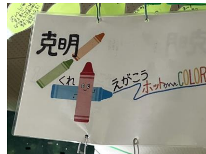
4年生 克明くれ4 えがこう ホットかへん COLOR