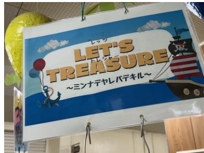
2年生 LET'S TREASURE ～ミンナテヤレバテキル～