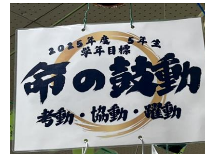
5年生 命の鼓動 考動・協動・躍動