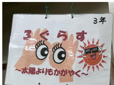
3年生 3 グラス ～太陽よりもかがやく～