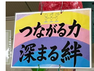
6年生 つながる力 深まる 絆