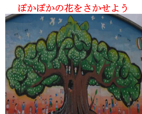
ねんせい 2年生 ぽかぽかの花をさかせよう