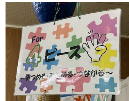
ねんせい 4年生 4 (フォー) ピース ~みつめる・みとめる・つながる~