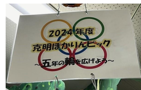
ねんせい 5年生 2024年度 克明ほかりんピック