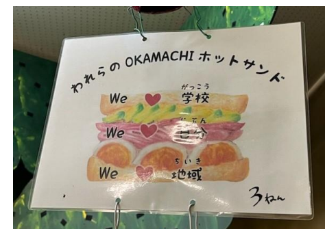
ねんせい 3年生 われらのOKAMACHIほっとさんど ~We♡学校 We♡自分 We♡地域~