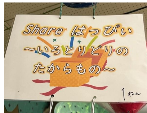
ねんせい 1年生 Share はっぴい ~いろいろどりの たからもの~

また、今年の各学年の目標テーマを気球につけて展示しています。1年生から6年生まで、大事にしたいことや子どもたちへの願いを込めて決め、取り組みを進めています。どれもこれからが楽しみになるテーマです。