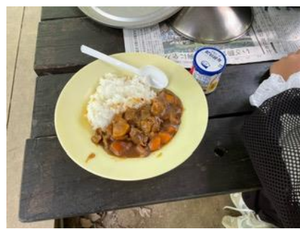
二日目の昼食は、自分たちで作ったカレーライス。最高！