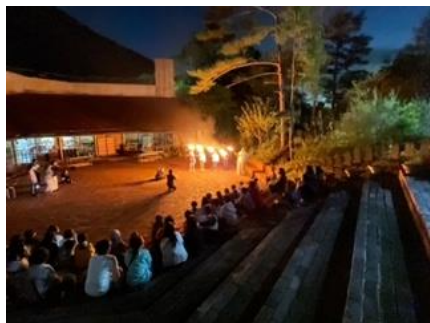
キャンプファイヤー 燃え上がる炎に夢を託して。