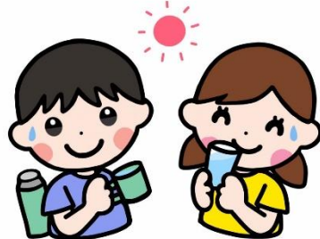
【こまめな水分補給】