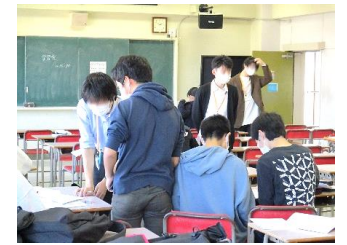
11月の学習会の様子

卒業式が3月14日なので、12月4日(日)は卒業100日前になります。3年生のみなさんの中学生時代もいよいよカウントダウンの始まりです。今の仲間と過ごす残り少ない一日一日を大切に、中学生時代のラストをクラス、学年でぐっと高まってしめくくってください!