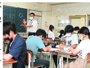
マンガだって文学的

最近の高校は、いろいろなコースや授業が用意されていたり、中学校にはないクラブ活動があったりします。7月13日に私立高校4校の先生をお招きし、全部で9つの出前授業を実施していただきました。3年生にとっては、興味引かれる2時間になったのではないのでしょうか。