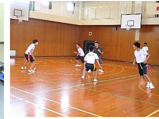
アメリカンフットボール