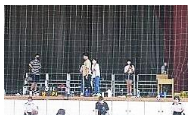
(ステージを掃除する3年生 十八中HPより)

今回は体育館の清掃に取り組みました。40人以上の人が参加して、体育館の倉庫やギャラリーや窓、ステージ等をきれいにしました。今回も一生懸命さがさわやかでした。