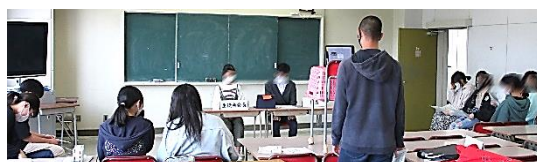
今年度初のリモート生徒集会

集会では生徒会役員や各学年、委員会の代表の人が前向きな抱負を語ってくれました。ボックスン・コハルんの呼びかけや、執行部とともに活動する「スーパー執行部」の募集もありました。多くの方が生徒会活動に参加することで、十八中は過ごしやすい学校になっていきます。多くの方が生徒会の呼びかけに応えてくれるのを期待しています！