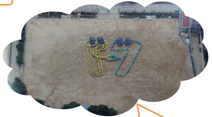
創立30周年 10年前、先輩方が空 に向かって色画用紙で 描いています。