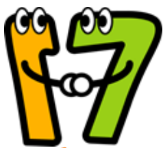
創立30周年 生徒からデザインを募 集して完成したキャラ クターです。