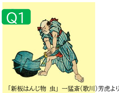
「新板はんじ物 虫」一猛齋(歌川)芳虎より