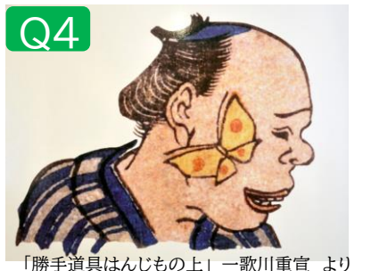
「勝手道具はんじもの上」一歌川重宣より