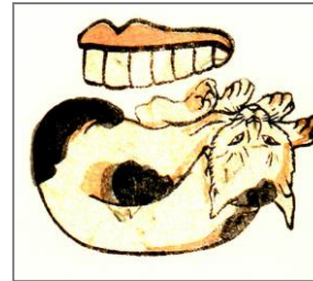
「東海道五十三次はんじもの」一歌川芳藤より