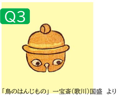
「鳥のはんじもの」一宝齋(歌川)国盛より