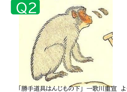
「勝手道具はんじもの下」一歌川重宣より