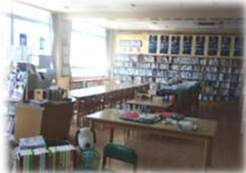
「5分後に意外な結末」のコーナーです