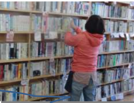
図書委員のおすすめコーナー