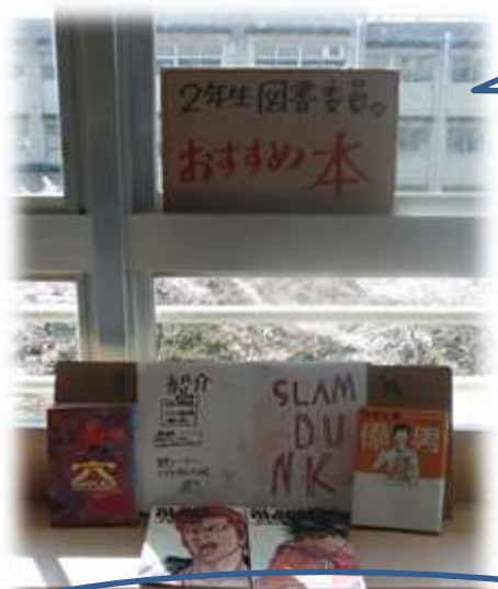
本のことなら司書の先生になんでも相談!