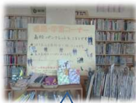
進路学習コーナー 高校の制服の写真も