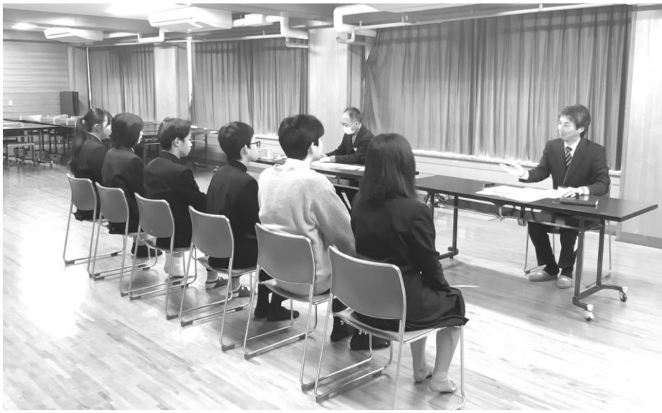
→ 12/9 進路「グループ面接練習」 3年生全員で行いました